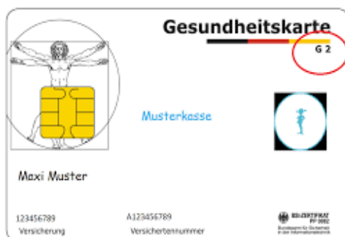
Muster einer Gesundheitskarte (Vorderseite)

Der Arzt rechnet dann direkt mit der Krankenversicherung ab.