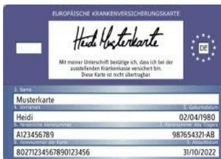
Muster einer Gesundheitskarte (Rückseite)

The doctor will send his/her bill to your health insurance provider.