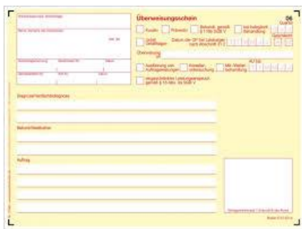
Bilet de trimitere

Pentru aceasta vă eliberează un bilet de trimitere (Überweisungsschein) .