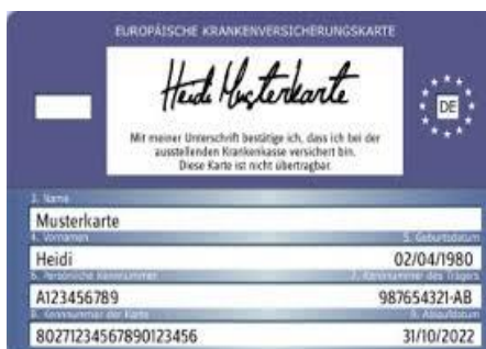
Muster einer Gesundheitskarte (Rückseite)

Medicul decontează apoi costurile direct la casa de asigurare.