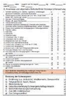
Mutterpass Innenblatt mit Untersuchungsdaten

Se recomandă ca gravida să aibă acest carnet mereu asupra sa, ca să i se poată acorda, ei și copilului pe care-l poartă, mai ușor ajutorul necesar într-o situație de urgență. Carnetul gravidei trebuie prezentat la fiecare consultație medicală, la cabinet, la spital sau la dentist. Aceasta fiindcă în timpul sarcinii multe medicamente și unele examene medicale sunt contraindicate.