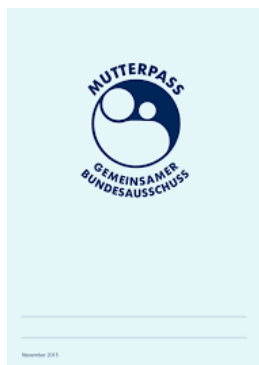
Mutterpass (Deckblatt) Carnetul gravidei (bractă)

Die Schwangere sollte den Mutterpass immer mit sich führen, damit ihr und dem werdenden Kind in einer Notsituation besser geholfen werden kann. Der Mutterpass muss bei jedem Arzt-, Krankenhaus- oder Zahnarztbesuch vorgezeigt werden. Bei Schwangeren dürfen nämlich viele Medikamente nicht verabreicht und manche Untersuchungen nicht durchgeführt werden.